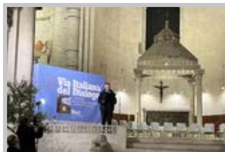
Primo simposio delle Chiese Cristiane