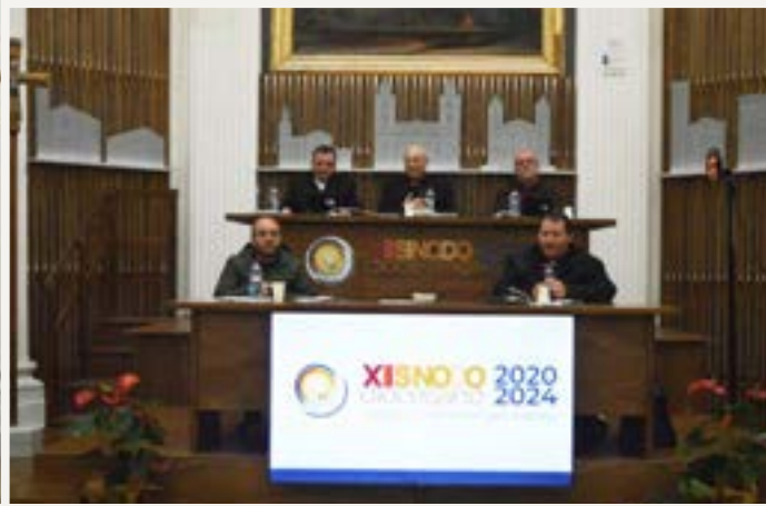
Il tavolo di coordinamento dell'aula sinodale

Dal 28 novembre 2020 all'11 ottobre 2025 la chiesa di Cefalù ha celebrato il XII sinodo diocesano. I tre temi affrontati (unità pastorali sinodali, iniziazione cristiana e fede popolare), hanno scandito le tre fasi del sinodo: ascolto, celebrazione, attuazione.