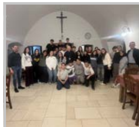
La visita del vescovo Giuseppe

Dopo cena ci siamo riuniti nel chiostro dove