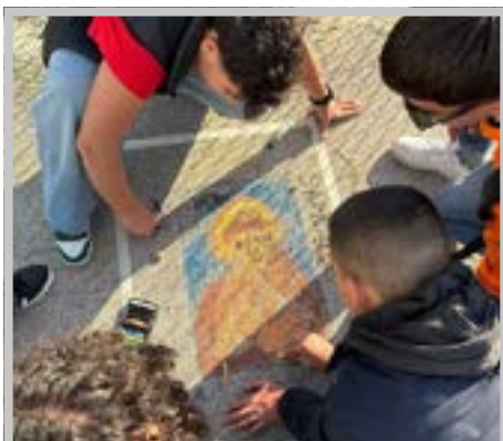
Un momento dei laboratori

Uno dei momenti più significativi del Me-