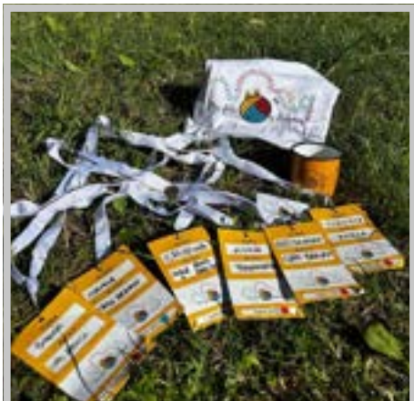
Badge e gadget del Convegno nazionale

A lcuni capi della Branca Lupetti e Coccinelle della zona Bari sud hanno avuto la preziosa opportunità di partecipare al convegno nazionale sull'ambiente fantastico intitolato "Da filo a trama", svoltosi dal 15 al 17 maggio 2026. Questo appuntamento ha rappresentato un'occasione straordinaria di incontro, confronto fraterno e rilettura profonda di uno strumento identitario e fondante del metodo scout dedicato ai più piccoli. Il convegno nazionale ha permesso ai capi di riportare e valorizzare quanto vissuto all'interno dei territori. È stato un tempo di ascolto reciproco nato dal forte desiderio di confrontarsi, come comunità educante, a partire da domande come: cosa significa oggi parlare di ambiente fantastico?