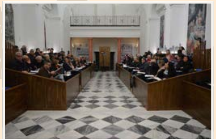
L'aula sinodale della Diocesi di Cefalù

Durante i lavori sinodali, il vescovo ha invitato le parrocchie della diocesi, attraverso una lettera, a riunirsi, più volte durante l'anno, in assemblea pastorale parrocchiale. Il vescovo ha proposto l'assemblea parrocchiale come sfida propositiva e provocatoria sul territorio, anche per le istituzioni civili, elevandola ad organismo di partecipazione alla vita ecclesiale. L'assemblea parrocchiale può