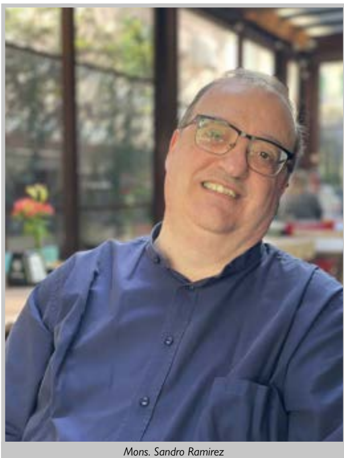
Mons. Sandro Ramirez

P romuovere «un turismo non ispirato ai canoni del consumismo o desideroso solo di accumulare esperienze, ma in grado di favorire l'incontro tra le persone e il territorio, e di far crescere nella conoscenza e nel rispetto reciproco. Se visito una città, è importante che non solo ne conosca i monumenti, ma anche che mi renda conto di quale storia ha dietro di sé, di come i suoi cittadini vivono, di quali sfide cercano di affrontare. Se salgo su una montagna, oltre a mantenermi nei limiti che la natura mi impone, dovrò rispettarla ammirandone la bellezza e tutelandone l'ambiente, creando così come un legame con gli elementi naturali fatto di conoscenza, riconoscenza e valorizzazione». Era il 22 marzo 2019 e, con queste parole, papa Francesco si rivolgeva ai dirigenti e ai soci del Centro Turistico Giovanile ricevuti nell'Aula Paolo VI.