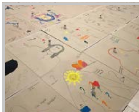
Una delle attività con il gruppo

Un’altra occasione di condivisione molto importante ed emozionante è stata la sera di giovedì 7 maggio iniziata nella Chiesa dei Pa-