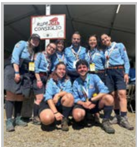
Capi della regione Puglia al Convegno nazionale

A lcuni capi della Branca Lupetti e Coccinelle della zona Bari sud hanno avuto la preziosa opportunità di partecipare al convegno nazionale sull'ambiente fantastico intitolato "Da filo a trama", svoltosi dal 15 al 17 maggio 2026. Questo appuntamento ha rappresentato un'occasione straordinaria di incontro, confronto fraterno e rilettura profonda di uno strumento identitario e fondante del metodo scout dedicato ai più piccoli. Il convegno nazionale ha permesso ai capi di riportare e valorizzare quanto vissuto all'interno dei territori. È stato un tempo di ascolto reciproco nato dal forte desiderio di confrontarsi, come comunità educante, a partire da domande come: cosa significa oggi parlare di ambiente fantastico?