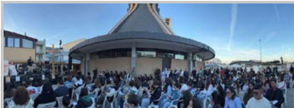
I giovani partecipanti al Meeting

Adolescenti e giovani protagonisti del meeting diocesano