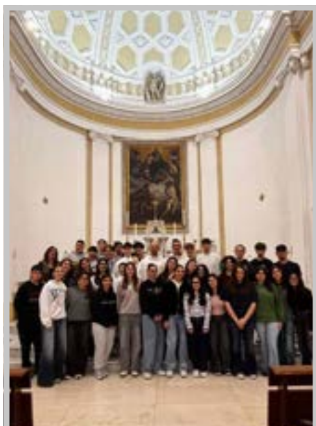
Tutti i partecipanti al termine della celebrazione eucaristica

La settimana di vita comune tra studenti, studentesse e seminaristi in Seminario a Conversano