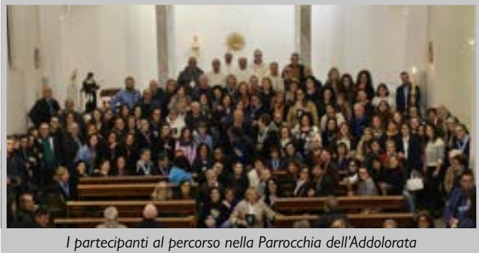
I partecipanti al percorso nella Parrocchia dell'Addolorata

La zona pastorale di Rutigliano a confronto per riscoprire la propria identità