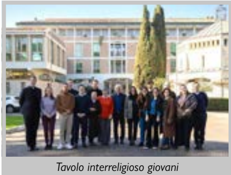
Tavolo interreligioso giovani

Non tacciamo la buona notizia di una strada di pace per questo tempo