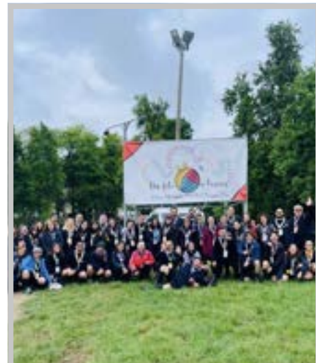
I capi della zona Bari sud al Convegno nazionale con Arcanda e Akela d'Italia

Il convegno è stato un pezzo di strada costruito insieme, che continuerà ora nelle nostre tane e nei nostri boschi, nelle riunioni di staff e nella vita di zona e comunità capi. Portiamo con noi un filo da custodire e tessere insieme, lasciandoci guidare dalle parole del Libro della giungla con cui si è chiuso l'evento: