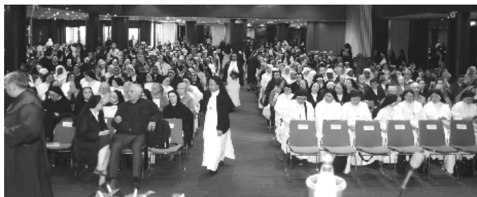
L'assemblea dei religiosi della nostra diocesi

D i una candida tovaglia, dopo averla guardata nel suo insieme spontaneamente, ci soffermiamo ad ammirare se è ornata di ricami e pizzi. La Vita Consacrata (VC) sta alla Chiesa, come i ricami stanno alla tovaglia. La Chiesa è bella, ma se perdesse anche uno solo degli Ordini Religiosi che lo Spirito ha suscitato nei secoli, si creerebbe un vuoto. I consacrati sono una ricchezza per la comunità ecclesiale.