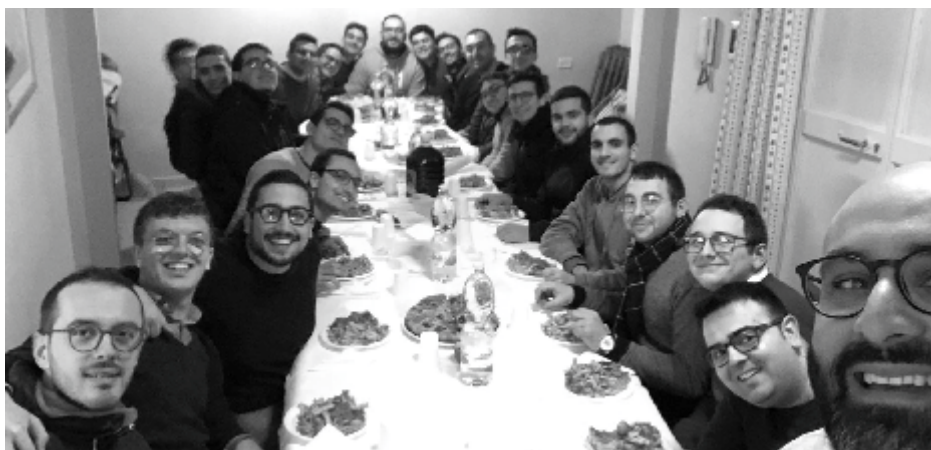
Un momento agapico dei seminaristi di I anno