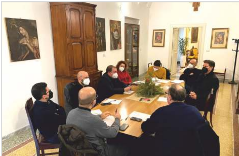
Uno dei gruppi sinodali con i direttori degli uffici di curia.

"Ascoltare è il primo passo, ma richiede una mente e un cuore aperti, senza pregiudizi" Arte sempre più rara, l'ascolto nella Chiesa è il punto di partenza per l'inclusione di tutti, specialmente delle donne e dei giovani, delle minoranze e di coloro che si trovano nelle periferie.