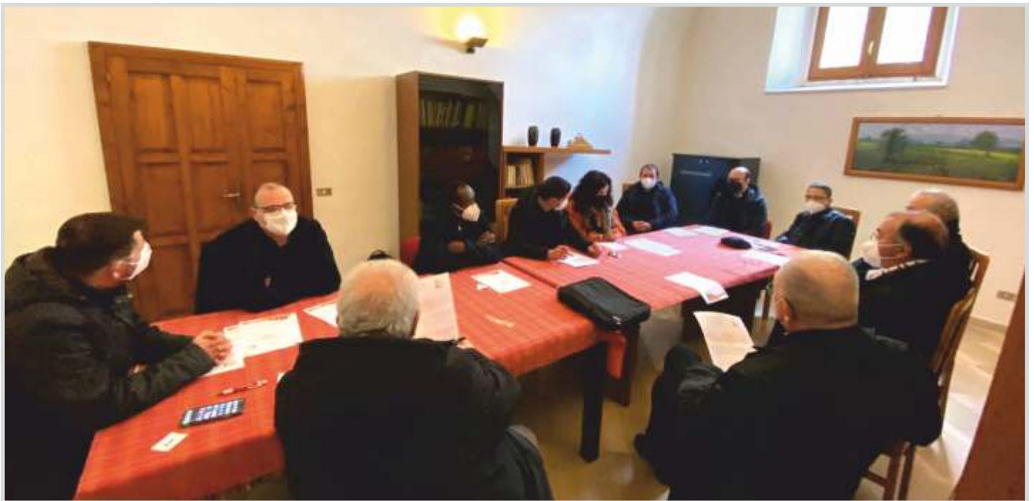
Gruppi sinodali con i presbiteri presso l'Oasi S. Maria dell'Isola Conversano.

soprattutto tra i cosiddetti “lontani”, grazie a questo invito all’ascolto da parte della Chiesa attraverso il Sinodo. Sembra necessario continuare con l’ascolto, la riflessione teologica/scientifica e il discernimento ecclesiale nella modalità sinodale sperimentata su questi temi e anche con queste persone, senza dimenticare altre categorie menzionate e riscoperte in questo processo (p.e. gli immigrati presenti sul territorio, gli anziani soli, i giovani lontani dalla comunità, etc.) per abbattere muri e superare confini, spesso invisibili ma non per questo meno reali.