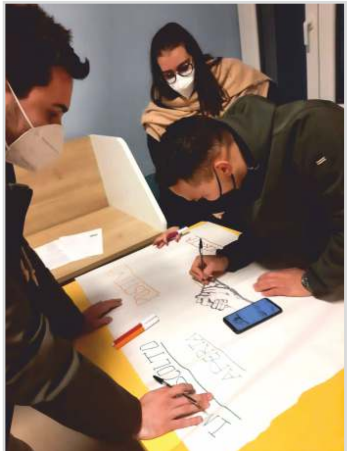
Gruppo sinodale con giovani e giovanissimi presso la parrocchia S. Maria del Carmine Pezze di Greco.