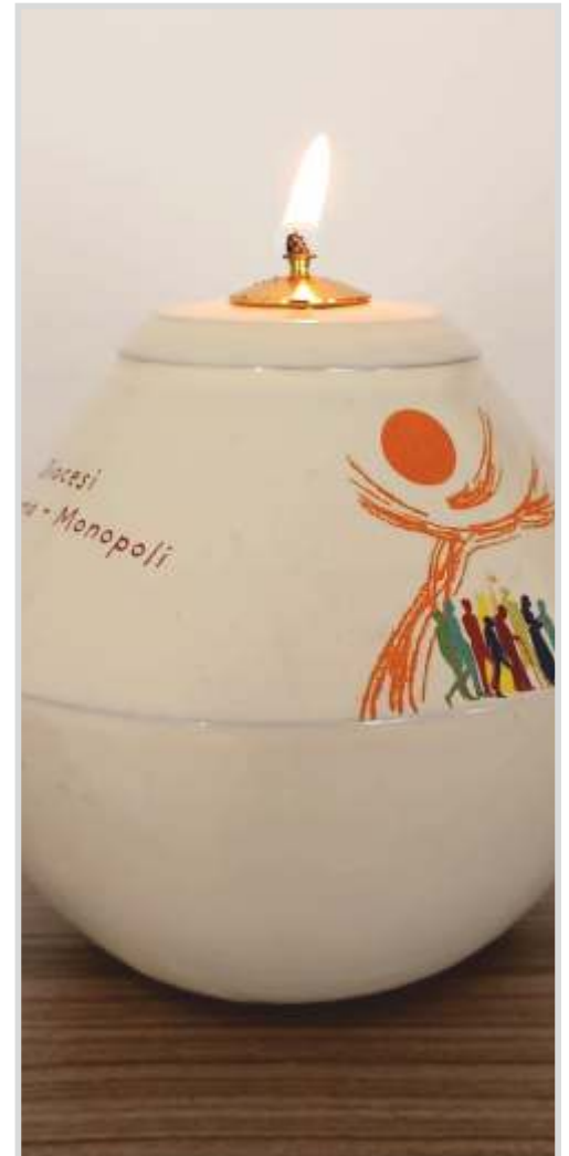
La lampada del Sinodo presente in tutte le comunità della diocesi