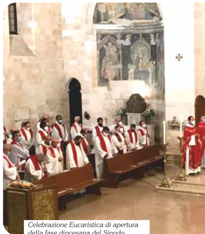
Celebrazione Eucaristica di apertura della fase diocesana del Sinodo.

lizzare nei gruppi sinodali organizzati attraverso due vie, la via delle comunità (a cura delle équipes parrocchiali) e la via degli ambienti di vita (a cura delle équipes di alcuni uffici diocesani: Caritas, pastorale familiare, IRC, pastorale sociale e del lavoro, pastorale della salute, comunicazioni sociali, cultura ed ecumenismo). Sono state approntate e pubblicate sul sito della diocesi delle schede per animare questi gruppi sinodali , sintetizzando e adeguando le domande tematiche, offrendo delle schede semplificate per i cosiddetti "lontani" e delle attività per i gruppi sinodali di giovani sia nelle parrocchie che nelle scuole superiori, così come delle schede anche per redigere le sintesi dei gruppi e le sintesi parrocchiali/zonali ( http://www.con-versano.chiesacattolica.it/materiali-e-schede/ ). Il mensile diocesano accompagna questo percorso con articoli e una rubrica sul sinodo in ogni numero da ottobre 2021.