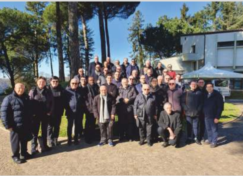
I presbiteri in formazione presso il centro Ad Gentes – Nemi.

Le esperienze sinodali ricordate soprattutto nei gruppi più vicini al mondo ecclesiale, accompagnate dai ricordi del passato di persone più distanti, lasciano intravedere l'immagine di una diocesi abituata a camminare secondo uno stile sinodale. In questo senso, le provocazioni all'inclusione e al cammino comune, derivanti dal pontificato di papa Francesco, sembrano porsi in continuità con un percorso intrapreso già da diverso tempo, nonostante da parte di alcuni sia stata segnalata la fatica nel percepire come sinodali alcune esperienze intraprese in passato. A livello diocesano , c'è chi ha ricordato non soltanto le iniziative degli ultimi anni (il convegno diocesano in occasione del rinnovo degli organismi di partecipazione, cantieri e progetti proposti in cooperazione tra diversi uffici di curia, l'agenda diocesana, i tavoli di discernimento post-Covid) ma anche alcune scelte più lontane nel tempo (i due progetti diocesani a cavallo degli anni '90-2000, le visite pastorali, il tentativo di riforma della curia, l'avvio del progetto Polico-ro, la nascita della radio diocesana e del Consultorio, l'Istituto di Scienze Religiose) ritenute una ricchezza a disposizione dell'intera comunità diocesana, terreno fertile per la stessa consultazione sinodale. A livello zonale e parrocchiale , nonostante le fatiche segnalate in diverse realtà, sono emersi numerosi tentativi di