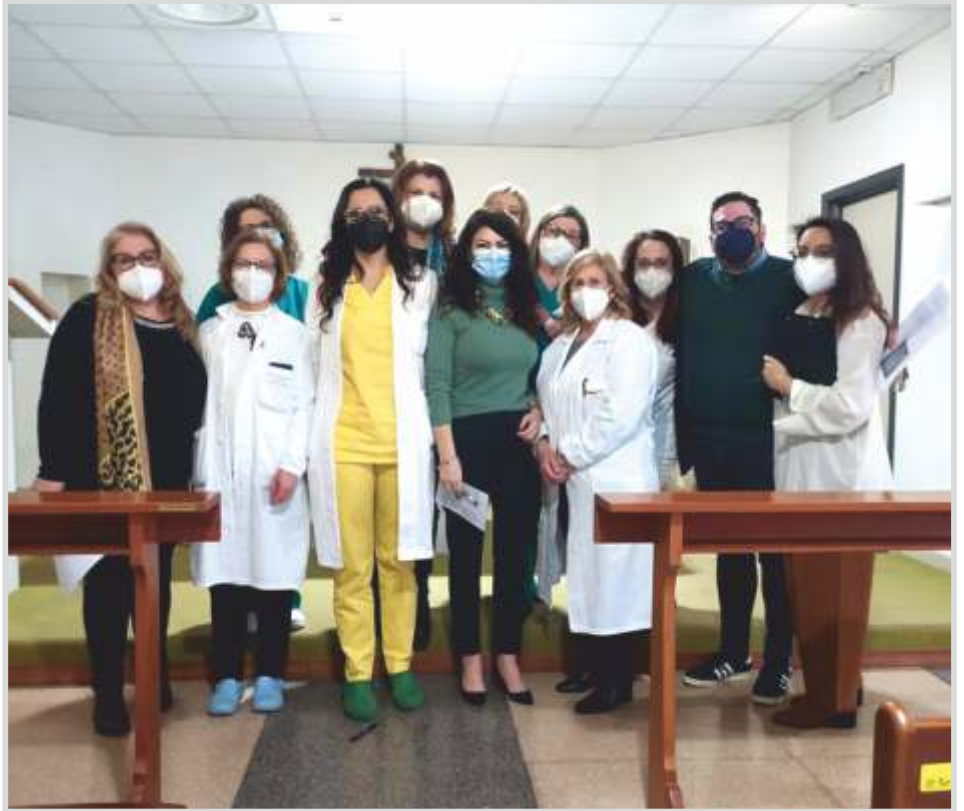
Uno dei gruppi sinodali con medici e operatori sanitari dell'ospedale IRCCS Saverio De Bellis Castellana Grotte.

È stata la tematica maggiormente affrontata, che racchiudeva al suo interno la domanda centrale alla base della consultazione sinodale (cf. Documento Preparatorio , n. 26). Diversi gli sguardi e gli accenti degli interventi, anche alla luce della maggiore o minore appartenenza al mondo ecclesiale. Tra operatori pastorali, persone sulla soglia delle comunità e lontani, infatti, emergono comunanze e divergenze che proveremo a delineare.