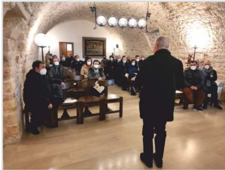
Gruppi sinodali con amministratori, sindaci e dirigenti presso l'Oasi S. Maria dell'Isola Conversano.