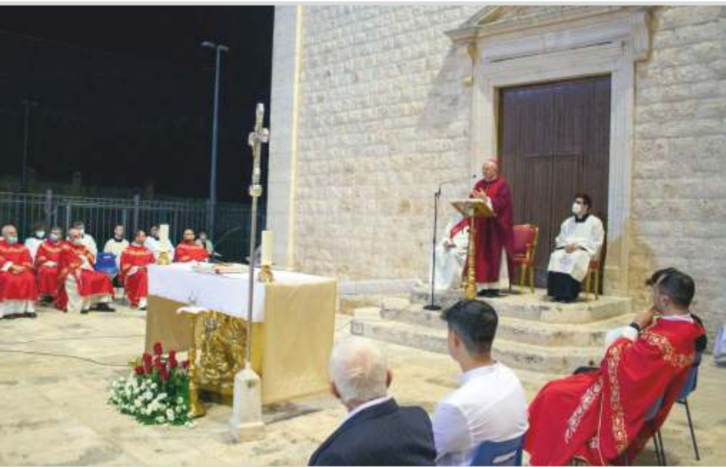
Il vescovo Giuseppe presiede l'eucaristia nella celebrazione di apertura dell'anno formativo presso il Seminario diocesano – Conversano.